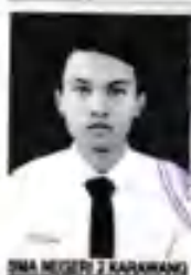
SMA NEGERI 2 KARAWANG